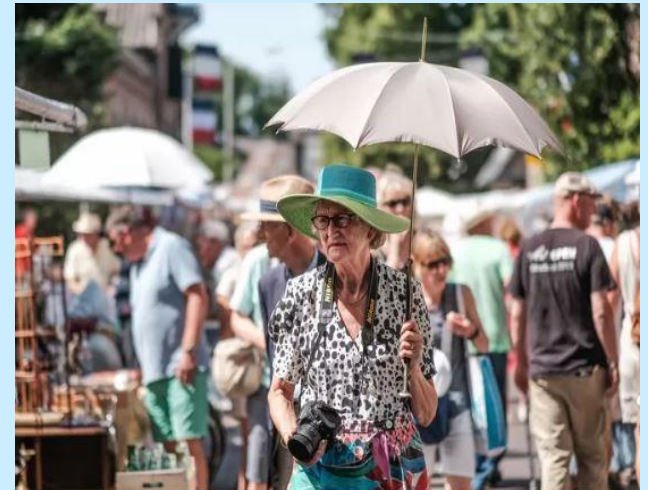
▲ Vive la France in Hummelo gaat zondag door, maar de markt sluit eerder. Archiefoto.