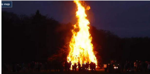
Door Lysanne Sniijders