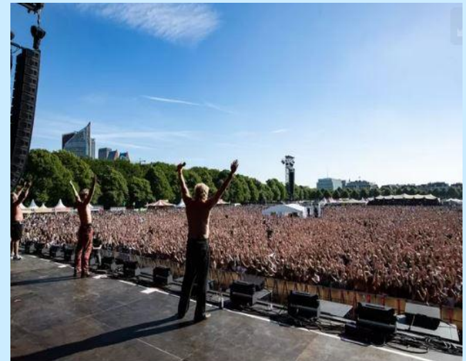
▲ Goldband op Parkpop 2022 op het Malieveld.