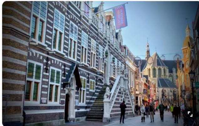
De vlag van 450 jaar Alkmaar Ontzet hangt vanaf nu in top bij het stadhuis - Foto: NH Nieuws/ Anne Klijnstra

The Alckmaer Proms, of Alkmaar Alive, het feest dat de grote apotheose moest worden van 450 jaar Ontzet, gaat niet door. Op het evenemententerrein aan de Olympiaweg in Alkmaar zou een groots feest gehouden worden met een keur aan bekende artiesten. Maar de ruim 30.000 mensen die er op zondagavond 8 oktober verwacht werden, moeten op zoek naar ander vertier. "Echt heel erg jammer."