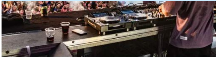
▲ Het Deventer Stadsfestival was in 2022 nog een groot succes. Dit jaar kan het evenement niet doorgaan.