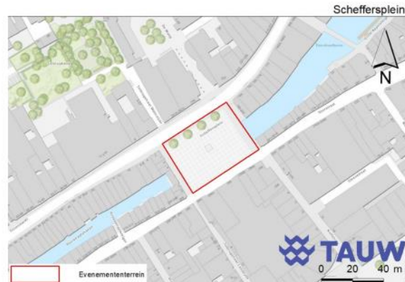
Figuur 5.1 Ligging van het Scheffersplein

Het Scheffersplein is een bestraat plein in het historisch centrum van Dordrecht. Figuur 5.1 geeft de ligging van het Scheffersplein. In figuur 5.2 is een impressie van het gebied weergegeven. Het plein wordt in de huidige situatie gebruikt voor terrassen van de omliggende horecagelegenheden. In de omliggende gebouwen zijn horecazaken, winkels en bewoning te vinden. Onder het Scheffersplein loopt een stadskanaal vanaf de wijnhaven in het noordoosten naar de Voorstraatshaven in het zuidwesten. De oevers van het kanaal bestaan uit begrenzing van bebouwing. Op het Scheffersplein staan een viertal bomen op de grens met de Wijnstraat in het noorden.