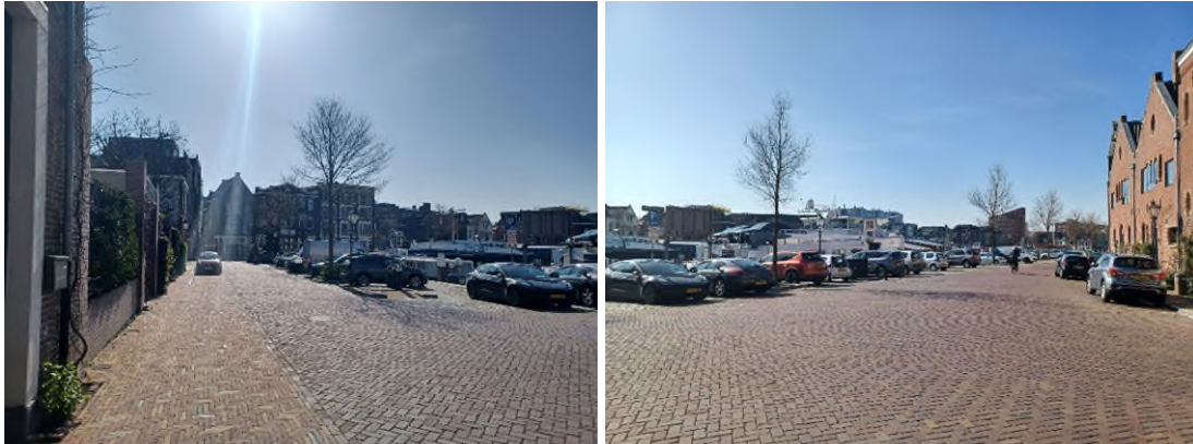
Figuur 11.2 Impressiefoto's van de Korte Kalkhaven