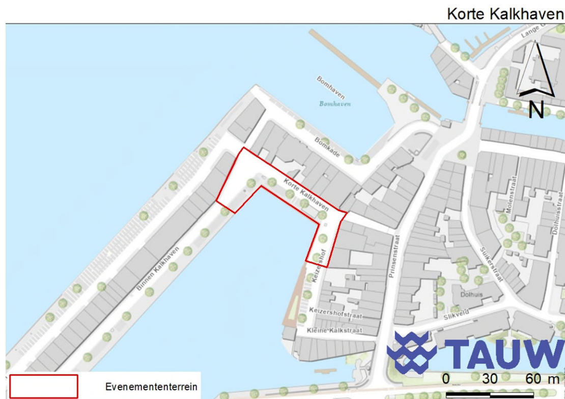
Figuur 11.1 Ligging van de Korte Kalkhaven

De Korte Kalkhaven is een bestraatte weg in het historisch centrum van Dordrecht. Figuur 11.1 geeft de ligging van de Korte Kalkhaven. In figuur 11.2 is een impressie van het gebied weergegeven. De weg is gesitueerd op de noordelijke kade van de Kalkhaven. De oevers van de Kalkhaven bestaan uit kademuren waar verscheidene boten aangemeerd liggen. Groenelementen op de weg bestaan uit bomen, boomspiegels, geveltuintjes en enkele private tuinen. Overige vegetatie is aanwezig in bloembakken bij het terras van de horecagelegenheid op de hoek met het Keizershof.