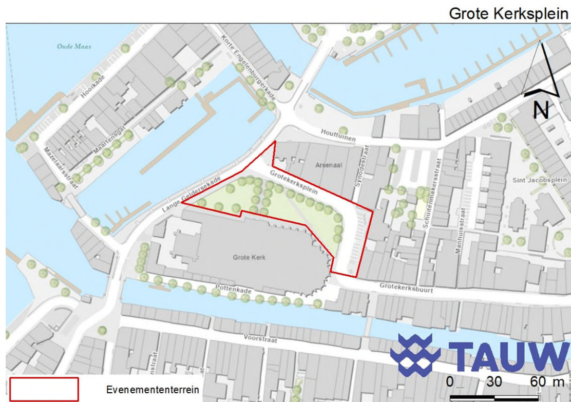
Figuur 9.1 Ligging van het Grote Kerksplein

De straat aan de randen van het grasland zijn betegeld met kinderhoofdjes. Het verkeer op deze straat bestaat uit auto's, fietsers en wandelaars. Aan de westzijde wordt het gebied begrenst door een bestraapte weg en de watergang Maartensgat. Deze watergang wordt aan de westzijde als aanlegplaats voor boten gebruikt en bestaat aan de oostzijde uit een kademuur.