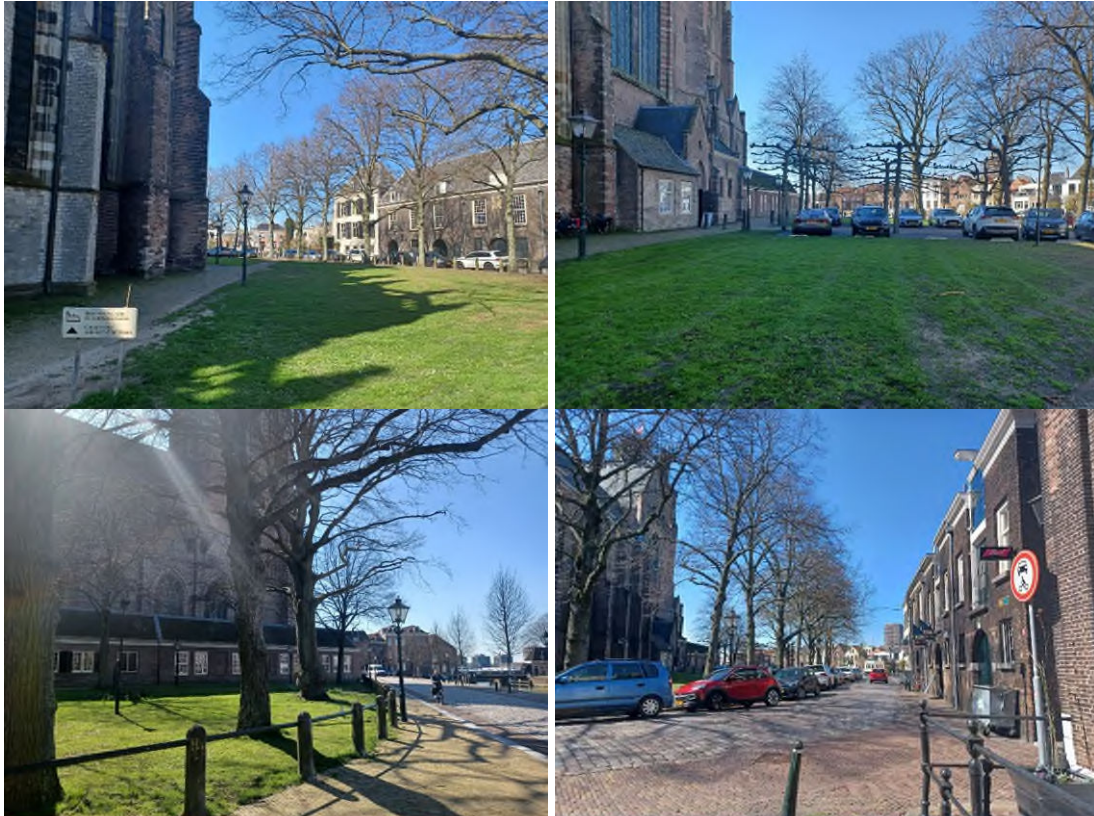
Figuur 9.2 Impressiefoto's van het Grote Kerkplein