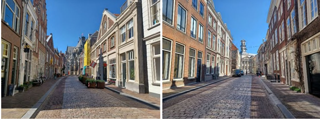
Figuur 8.2 Impressiefoto's van de Grote Kerksbuurt