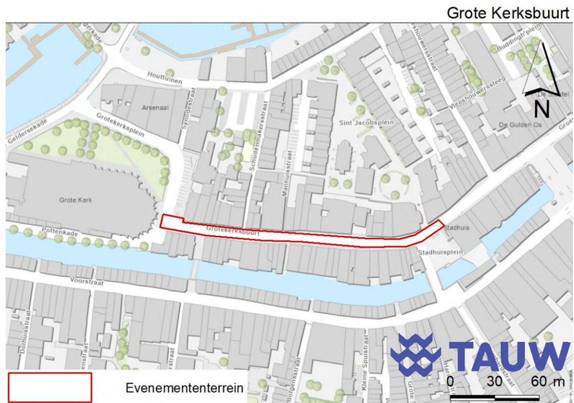
Figuur 8.1 Ligging van de Grote Kerksbuurt

De Grote Kerksbuurt is een bestrachte weg in het historisch centrum van Dordrecht. Figuur 8.1 geeft de ligging van de Grote Kerksbuurt. In figuur 8.2 is een impressie van het gebied weergegeven. De weg is geheel bestraat, waarbij groenelementen te vinden zijn in enkele buiten geplaatste plantenbakken en een aantal geveltuintjes. In de straat bevindt zich een afgesloten tuin waar een kleine vijverbak, lage beplanting en een boom aanwezig is. Het verkeer op de weg bestaat uit auto's, fietsers en wandelaars. De bebouwing aan deze weg bestaat uit woningen, horecagelegenheden, ateliers en winkels.