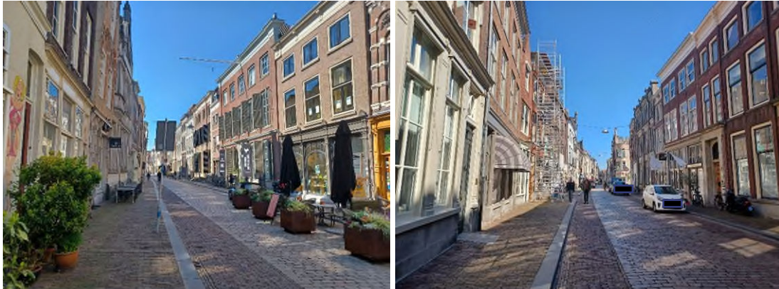
Figuur 6.2 Impressiefoto's van de Groenmarkt